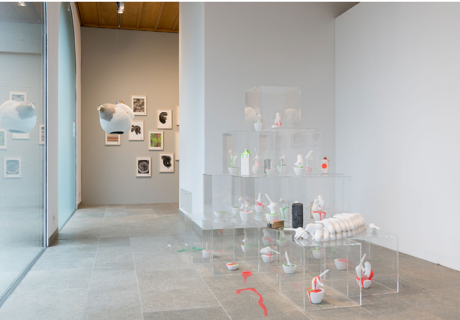
Battlefields of Cupiditas / Einzelausstellung: Nina Staehli / © Ullmann Photography / 2019