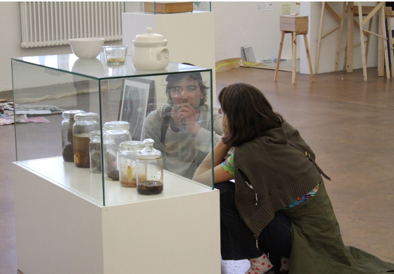
Valentin Beck, Installation: Der Mythos des Sauerkrauttopfs, Ausstellungsansicht: HAUS, aaku Kunstplattform