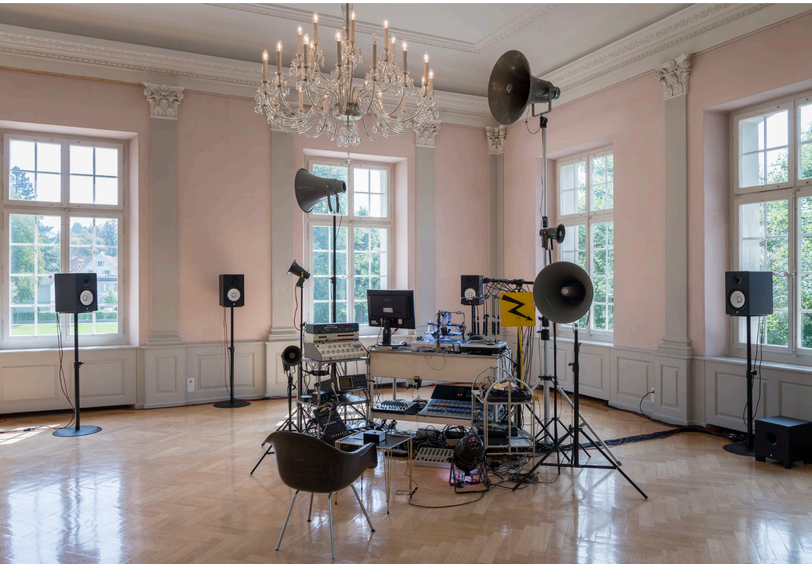
neoscope17 / Installation: Micha Bietenhader, Timo Ullmann / 2017