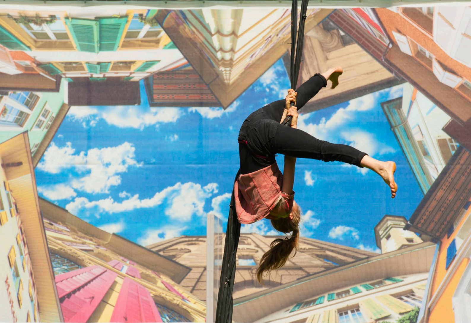
Schwarz-Weiss-in-Farbe / Matinee / © nicijost / 2015