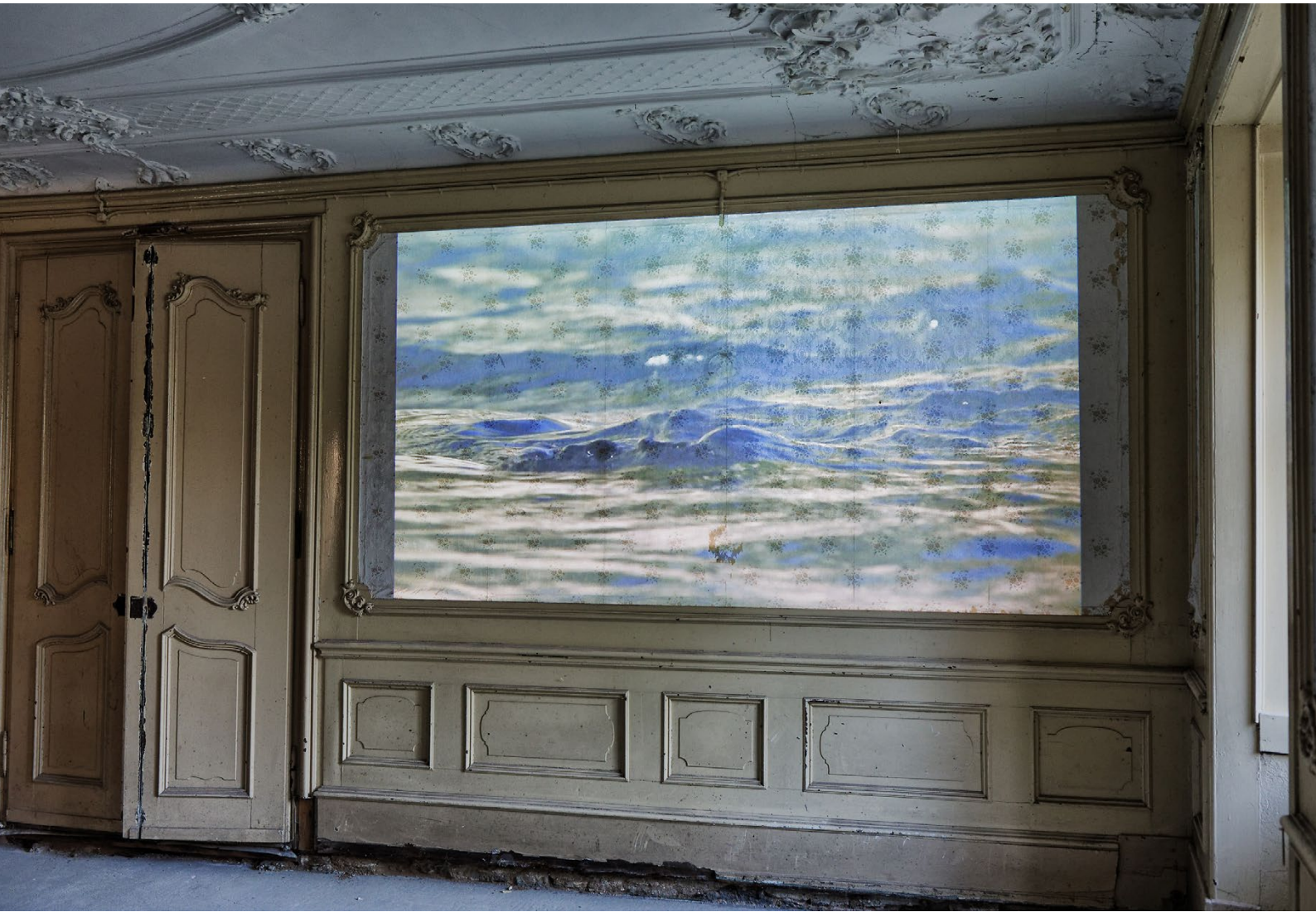
Eva Borner / Installation Zwischen der Stille, Raum 1 / © Eva Borner, 2024