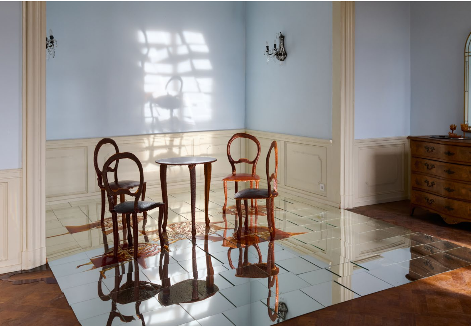
Ursula Palla / Das Karamellzimmer, © Nici Jost / Schloss Gleina, 2024