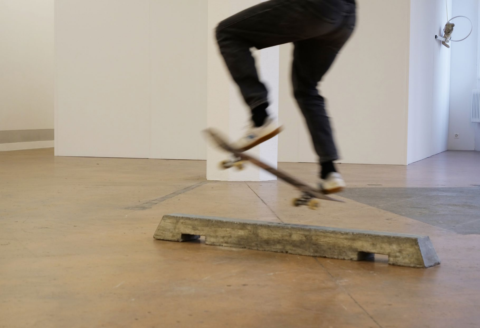
Ausstellung: HAUS, Vernissage (Einzug), aaku Kunstplattform