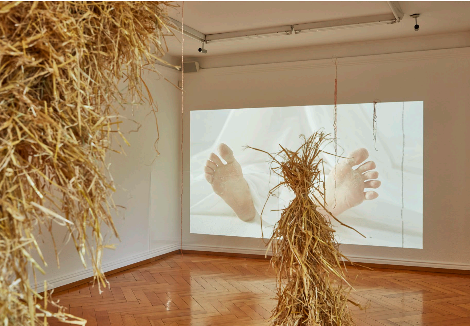
Seline Baumgartner / Gruppenausstellung: Put on Your Red Shoes and Dance the Blues / Installationsansicht, Kunstmuseum Olten