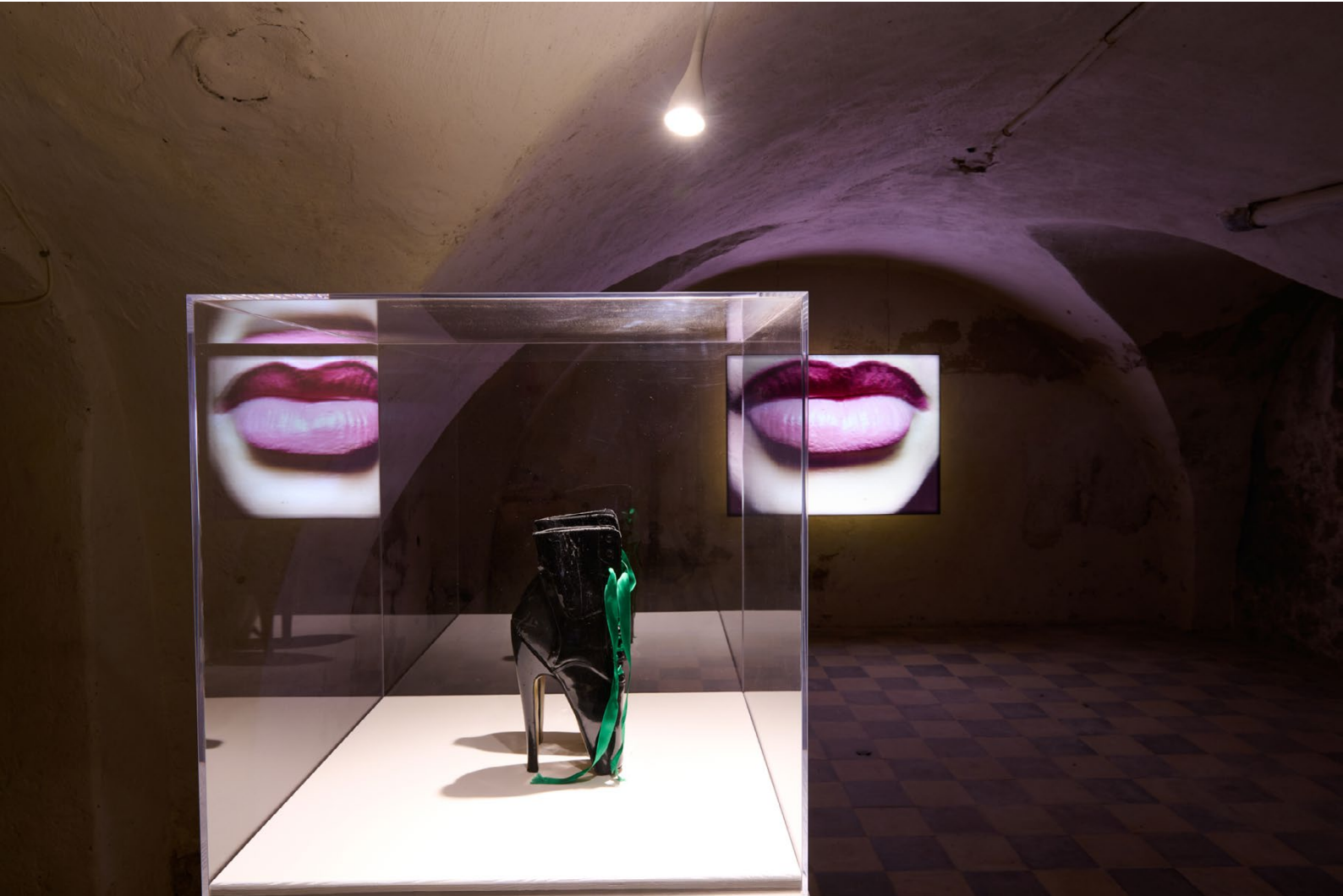
MANON / Ausstellung KOSMOS.KAOS, Schloss Gleina / Installation Lackschuhe und Lippen / 2024