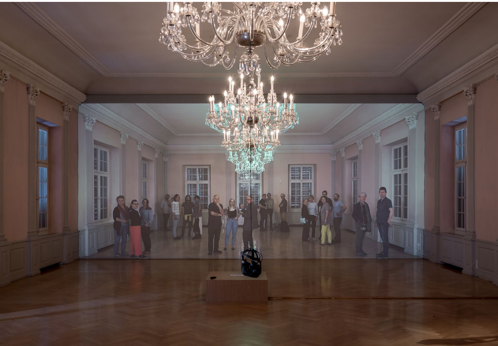
neoscope19_Installation: Roger Wirz, Thomas Hüsler / 2019