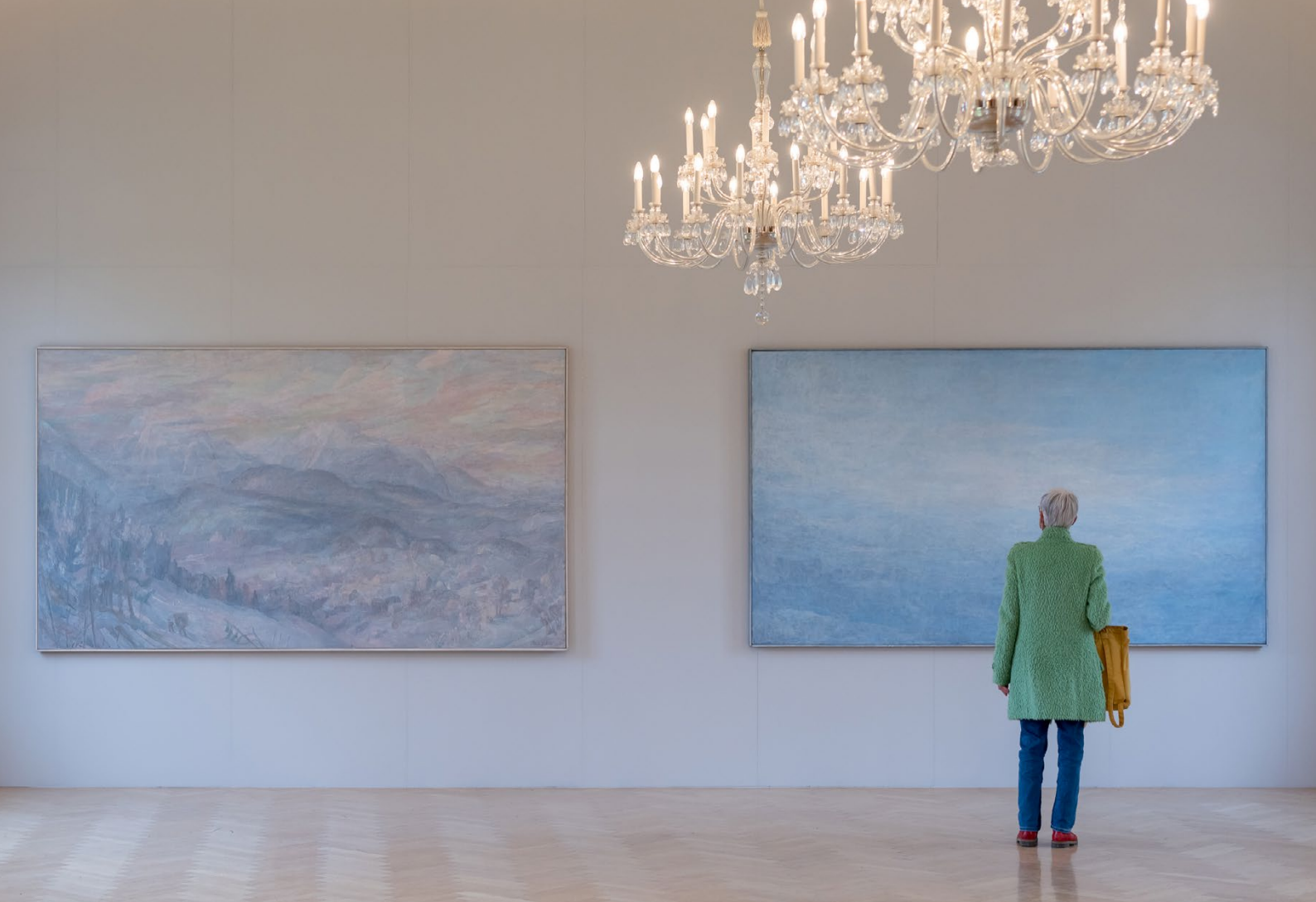
Ernst Waldner / Landschaftsmalerei, Ausstellungsansicht: HORIZONTE Kunsthaus Zofingen / © Timo Ullmann, 2024