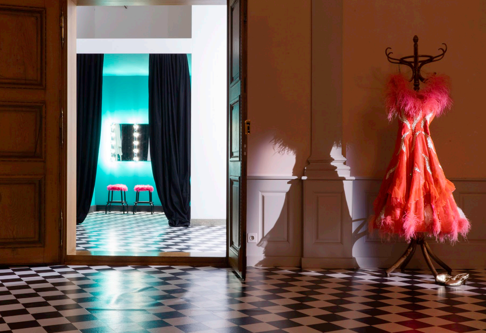
MANON / Einzelausstellung / Installation Lachgas /© Rachel Buehlmann / 2019