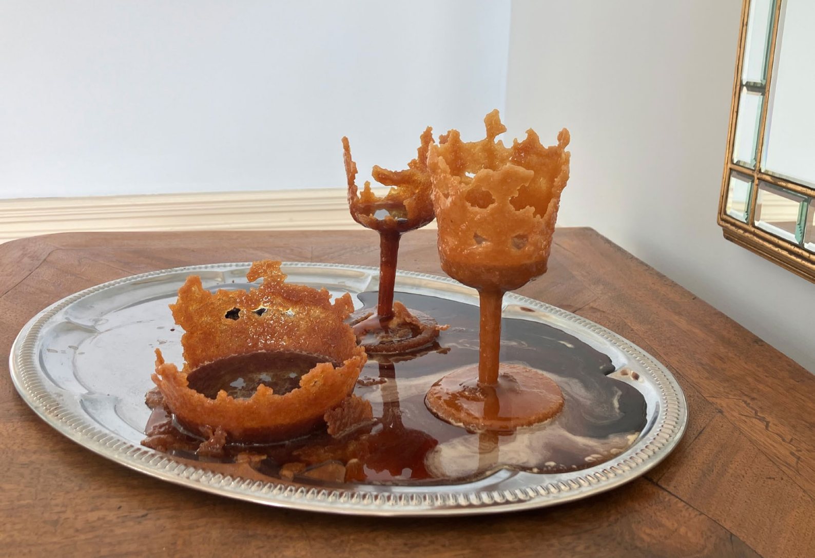
Ursula Palla / Das Karamellzimmer, Installation aus Zucker, KOSMOS.KAOS, Schloss Gleina / 2024