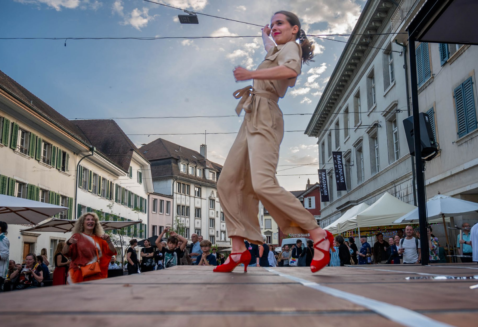
Put on your Red Shoes and Dance the Blues / Vernissage-Fest: TanInDenAbend / Kunstmuseum Olten © Peter Koehl, 2022