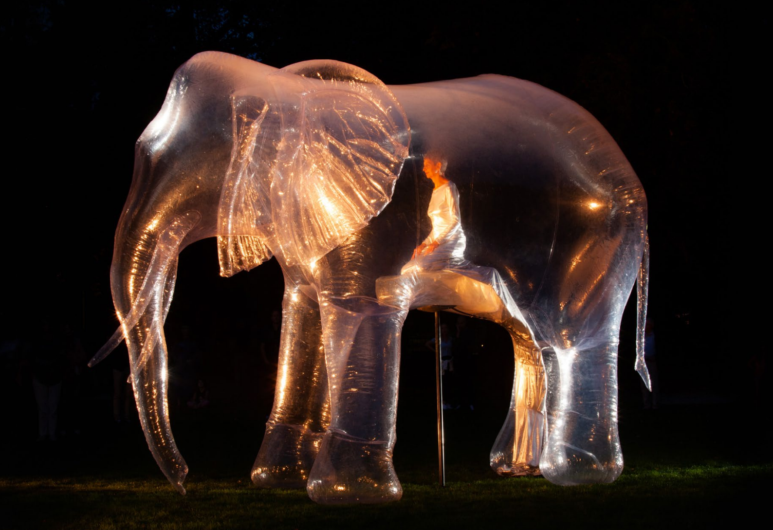
Victorine Müller / Performance Elefant, Vernissage zur Ausstellung Baumfänger, Kunsthaus Zofingen / © Rachel Buehlmann, 2021 com&com / Beat Breitenstein / Ausstellungsansicht Baumfänger, Kunsthaus Zofingen / © Rachel Buehlmann, 2021