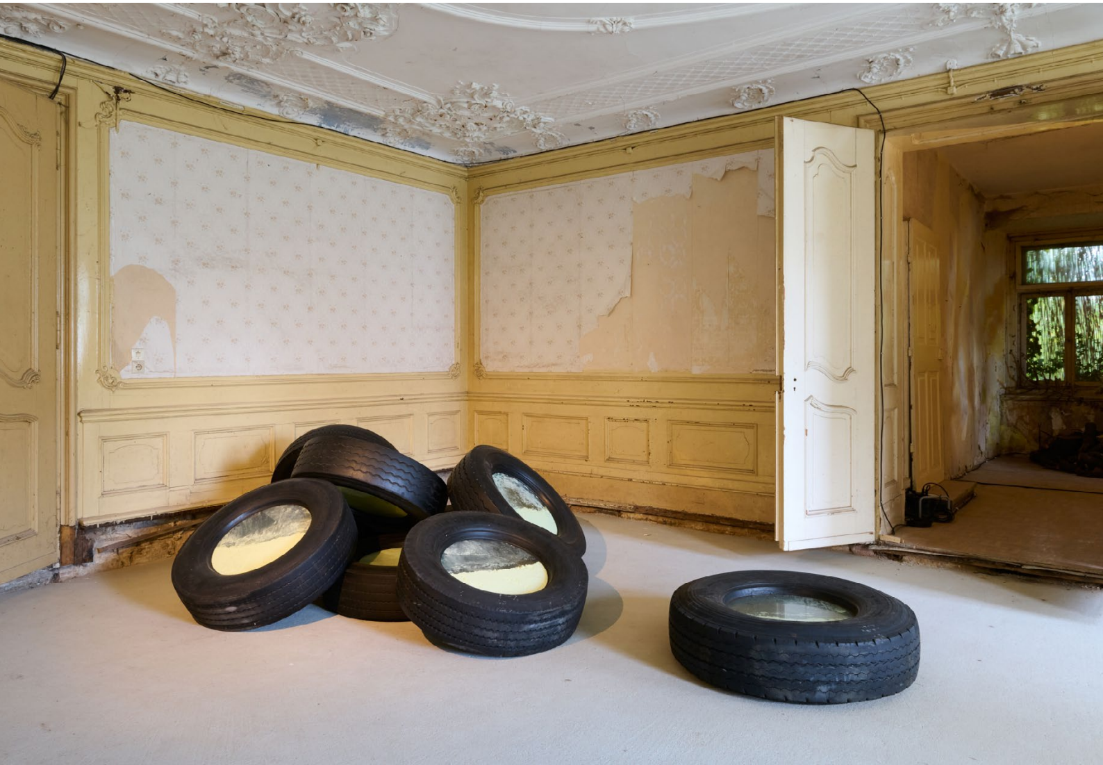
Ingeborg Lüscher / Ohne Titel, 1996 / Leihgabe Situation Kunst, Bochum / Ausstellung KOSMOS.KAOS / © Nici Jost / Schloss Gleina, 2024