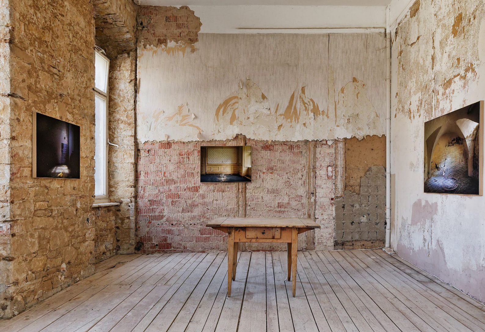
Eva Borner / Installation Zwischen der Stille, Raum 2 / Schloss Gleina KOSMOS.KAOS