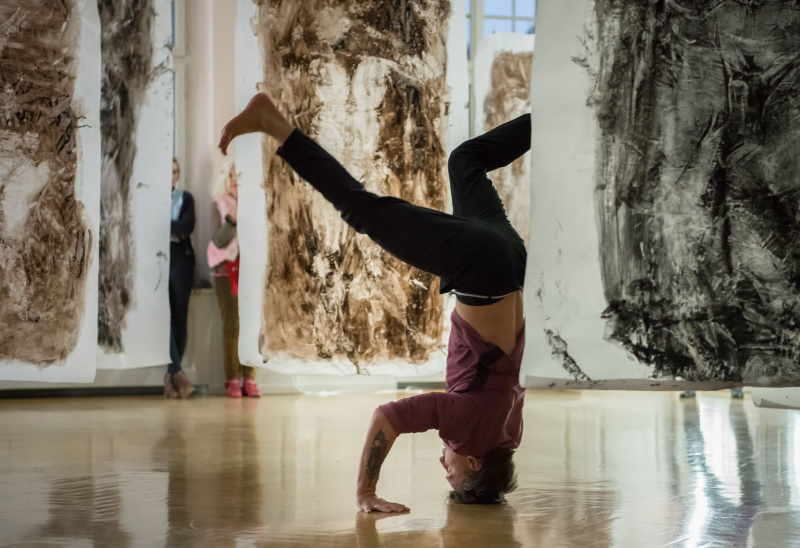
BODENLOS III / FormatEXTRA mit Tanz / 2017