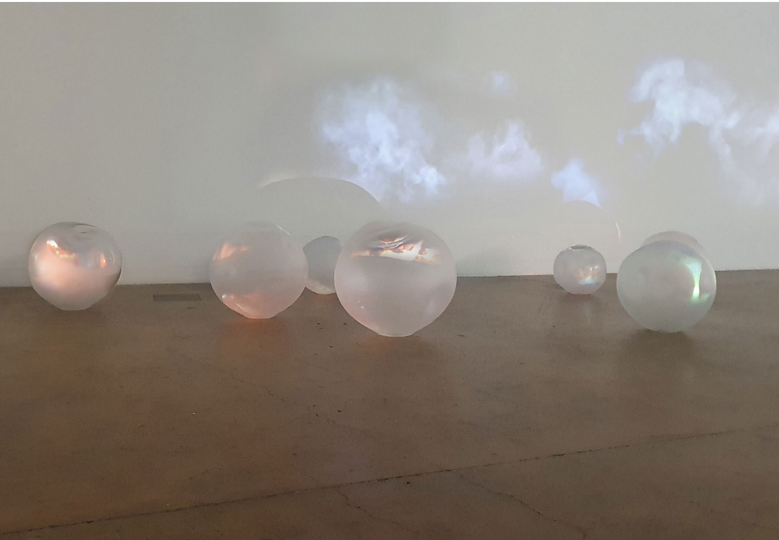
Ursula Palla / Installation: Afterglow, Planetenserie / Ausstellung: HAUT, akku Kunstplattform, Emmenbrücke / © Ursula Palla, 2023