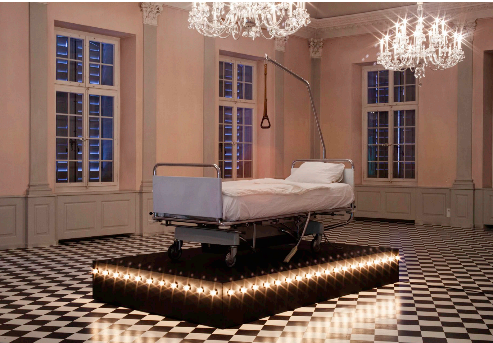
MANON / Einzelausstellung / Installation Lachgas /© Rachel Buehlmann / 2019