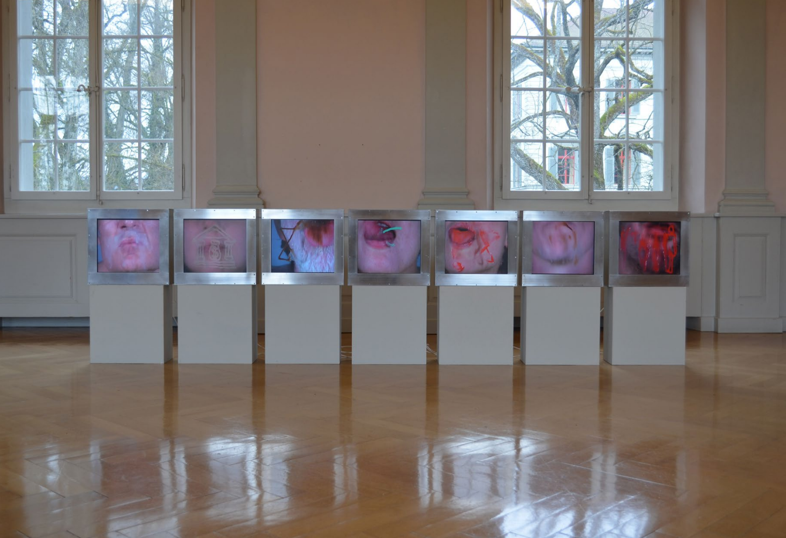
KUNSTWORT&BILDTEXT_Installation: Costatino Ciervo (Leihgabe: Ketterer) / © André Hartmann / 2019