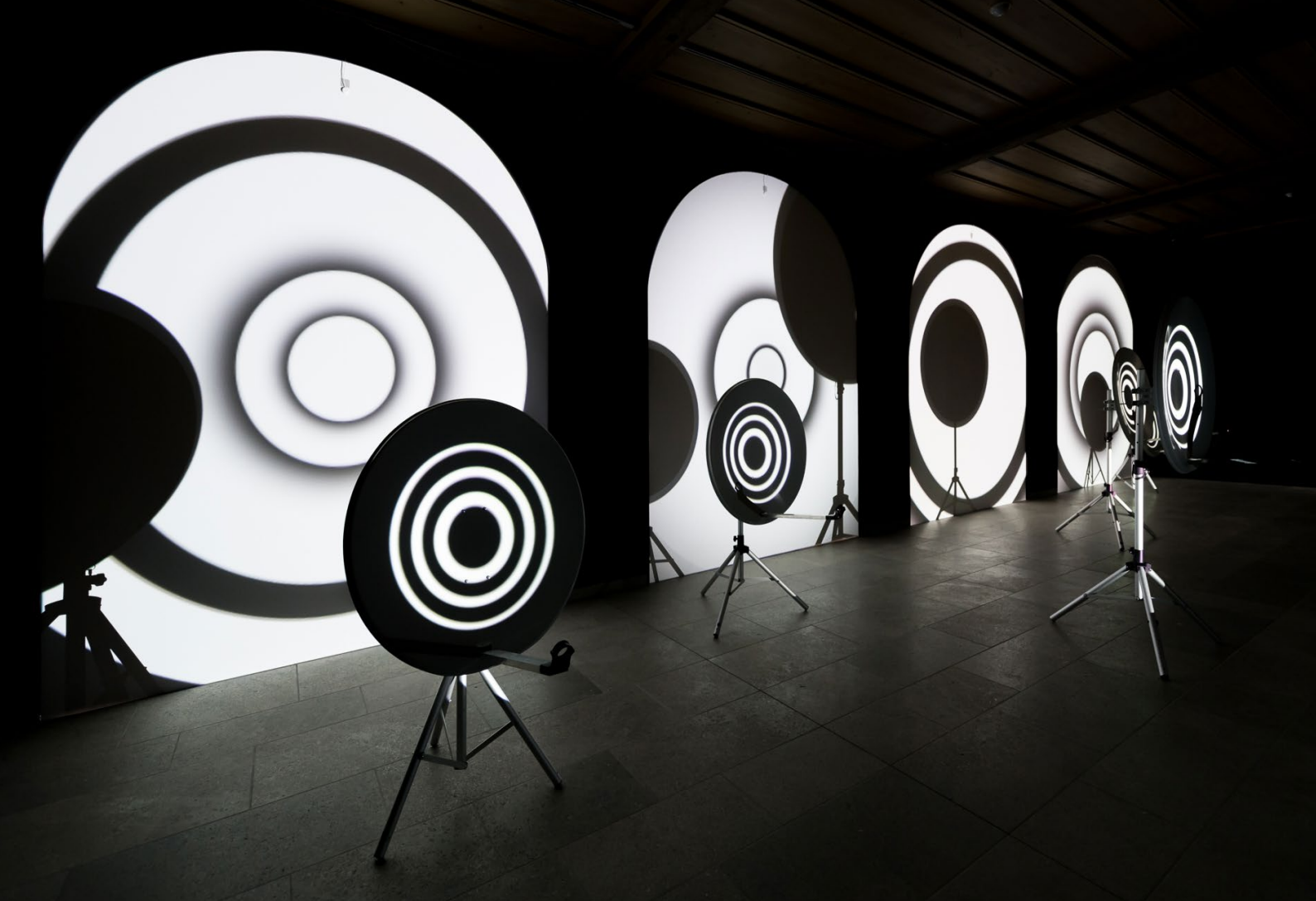
BODENLOS III / Installation: Manuela Hartel / © Ullmann Photography / 2017