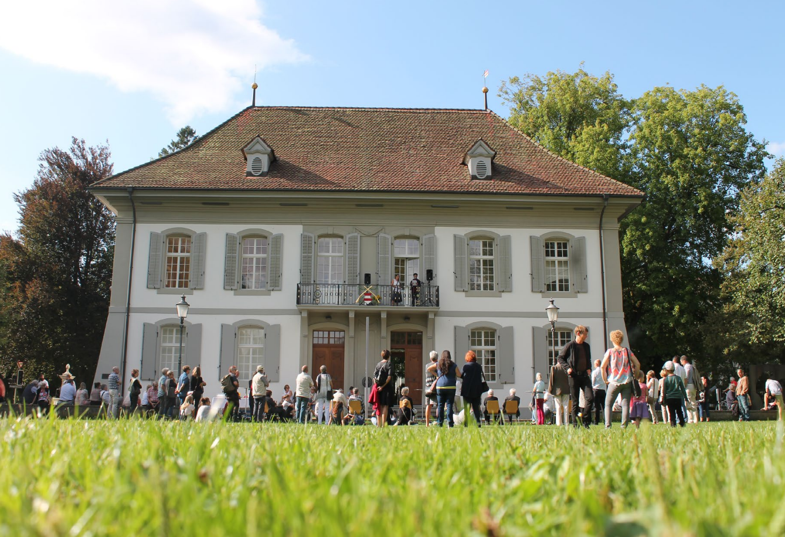
neoscope17 / Vernissage / © Ullmann Photography / 2017