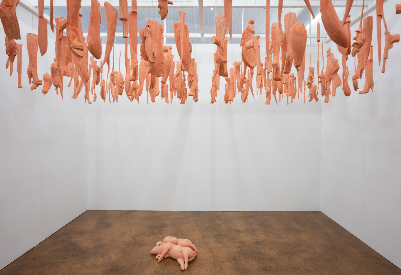
Rochus Lussi / «dünne Haut» 300 Teilig Pappelholz, Installation Ausstellung «Haut» akku Kunstplattform / © Christian Hartmann, 2023 HAUT / Ausstellungsansicht hier zu sehen Werke von: Heidi Bucher, Nesa Gschwend, Victorine Müller, Rochus Lussi / © Kim da Motta, 2023