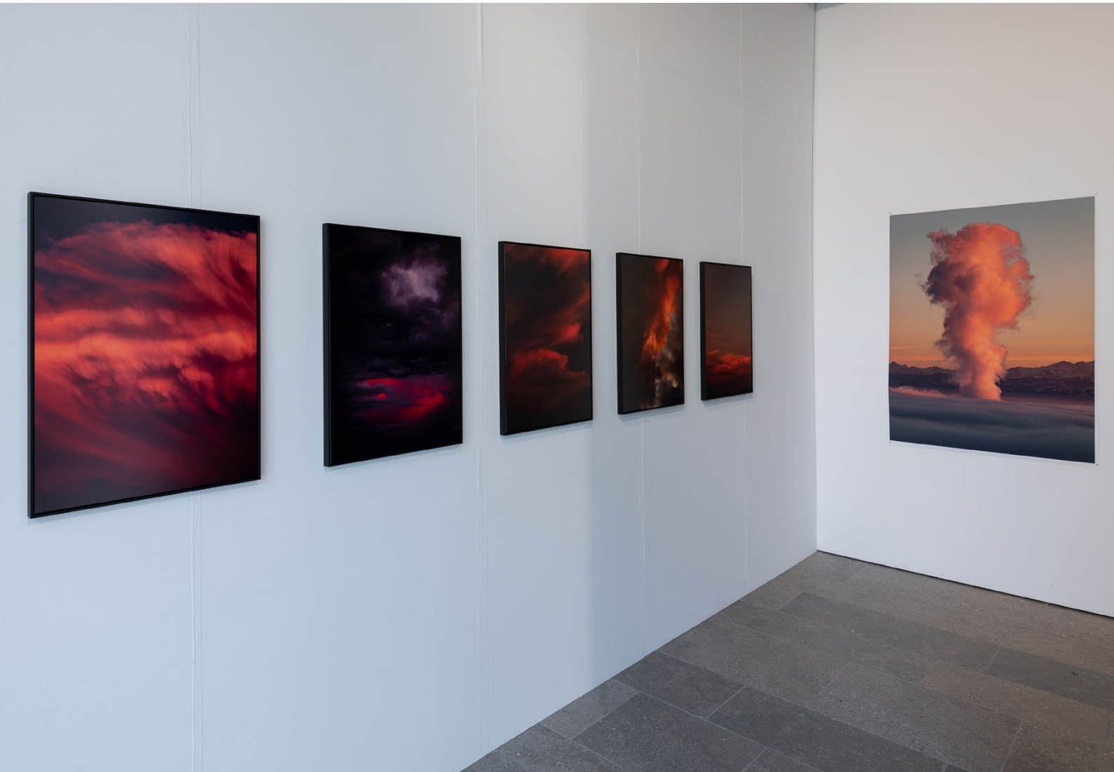
Rachel Bühlmann / Fotografien, Ausstellungsansicht: HORIZONTE Kunsthaus Zofingen / © Timo Ullmann, 2024